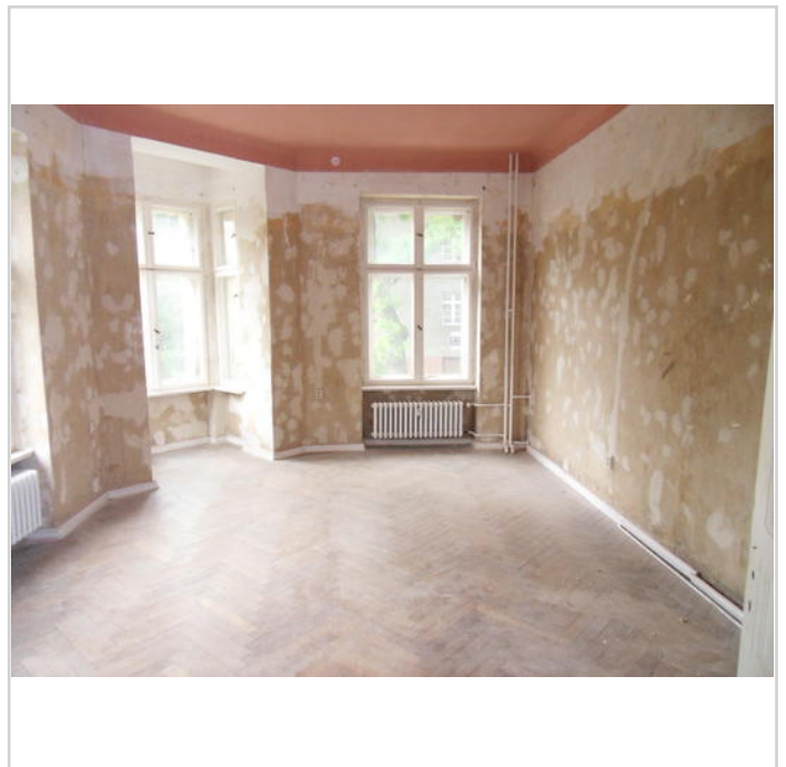
im 1. OG