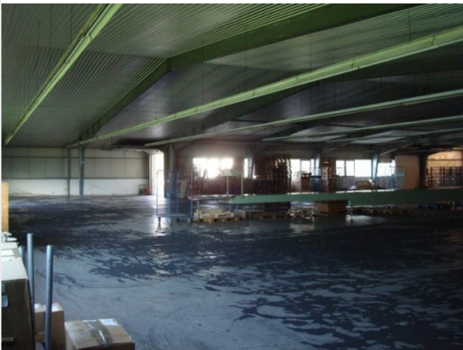
halle ansicht a