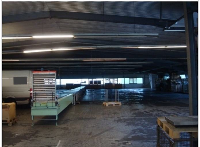
halle ansicht b