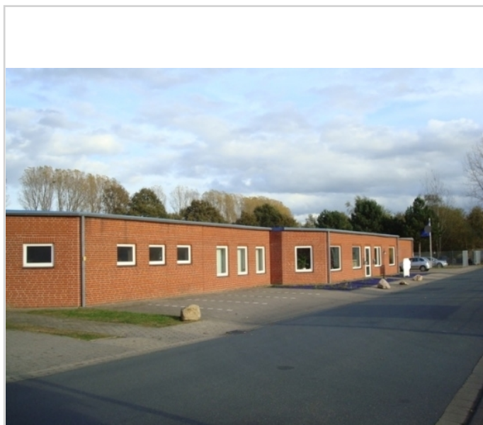
ansicht büros, südseite